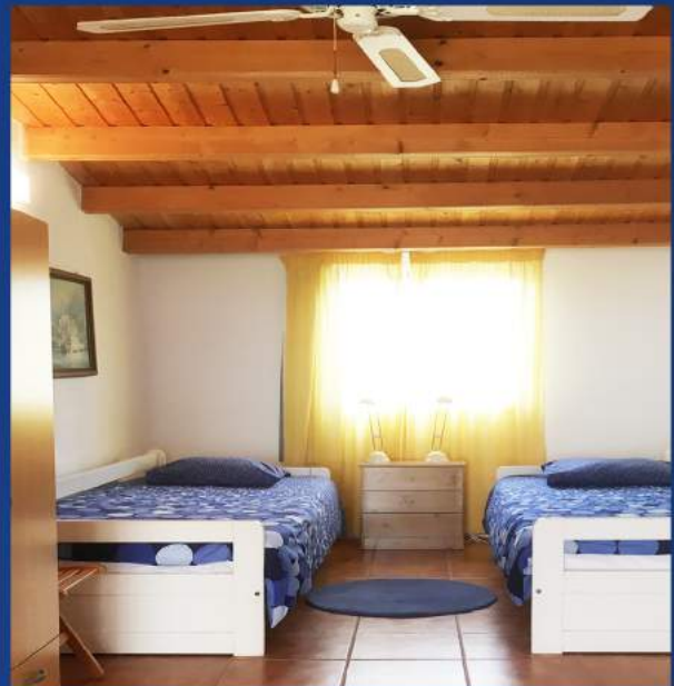
Von da aus gehts auf die Terrasse mit Blick aufs Meer

Der geräumige Mehrzweckraum im oberen Stock bietet Platz für 2 Betten, Schrank, Kommoden, Computer-Tischchen, etc.