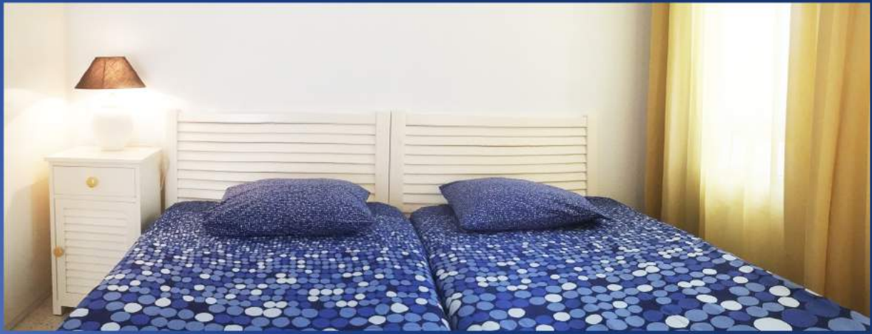
Das Schlafzimmer im unteren Stock

Der geräumige Mehrzweckraum im oberen Stock bietet Platz für 2 Betten, Schrank, Kommoden, Computer-Tischchen, etc.