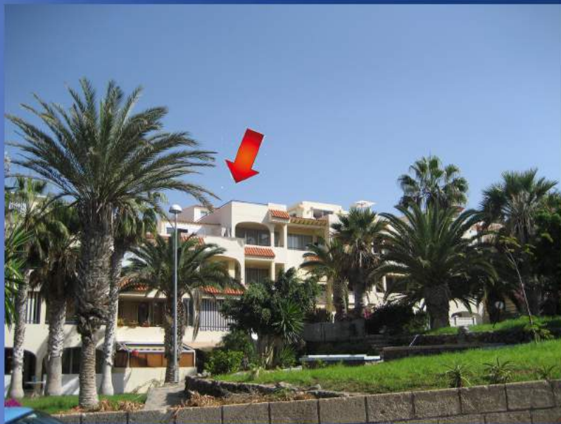
Blick vom Palmengarten auf die Wohnung

3. Stock: Mehrzweckraum mit 2 Betten und Computertischchen. W-Lan auf dem ganzen Stock, incl. Terrasse Dachterrasse mit atemberaubenden Panoramablick über den Atlantik und rückwärts zu den Bergen mit dem Teide.