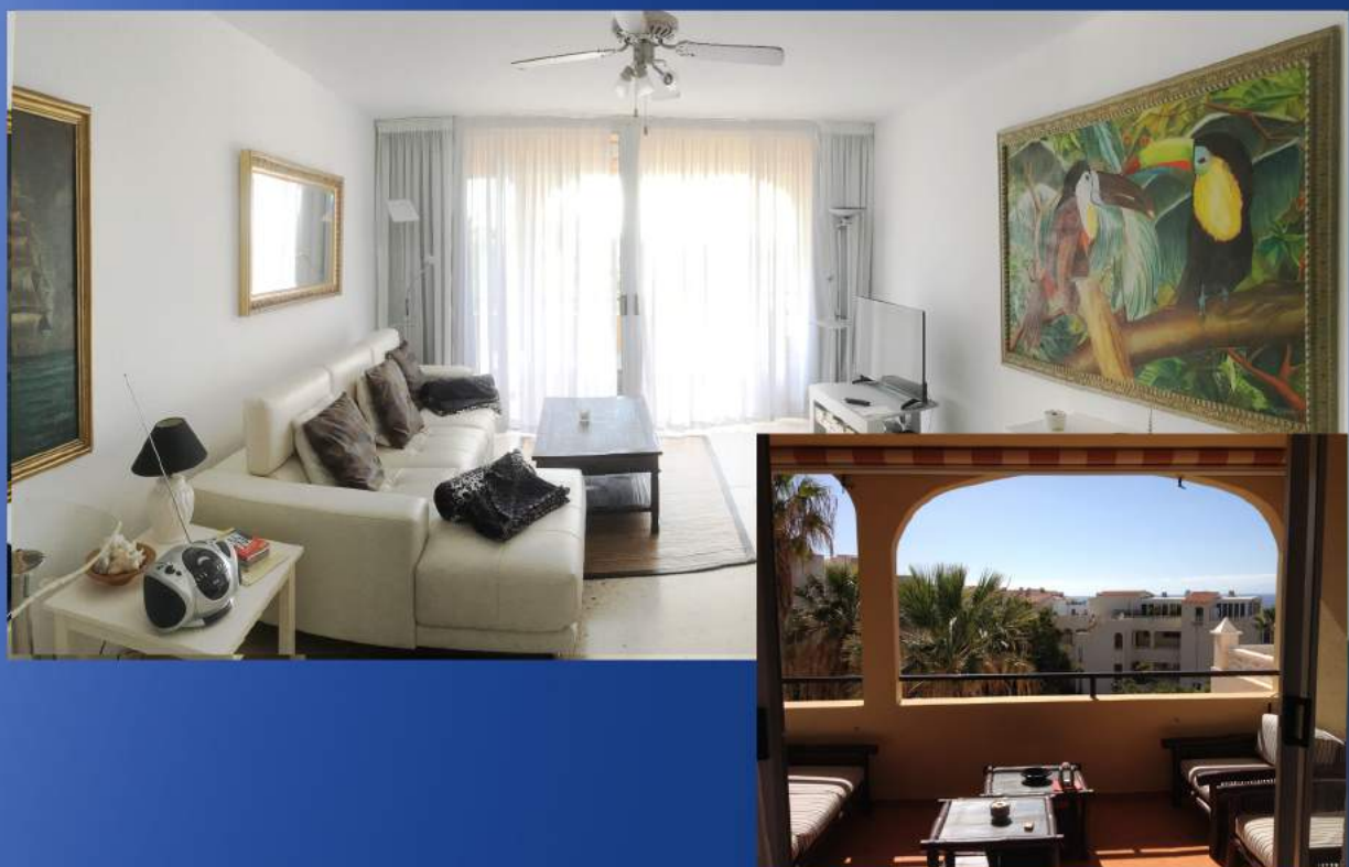
Das Wohnzimmer Die Doppeltüre im Hintergrund führt auf den Balkon